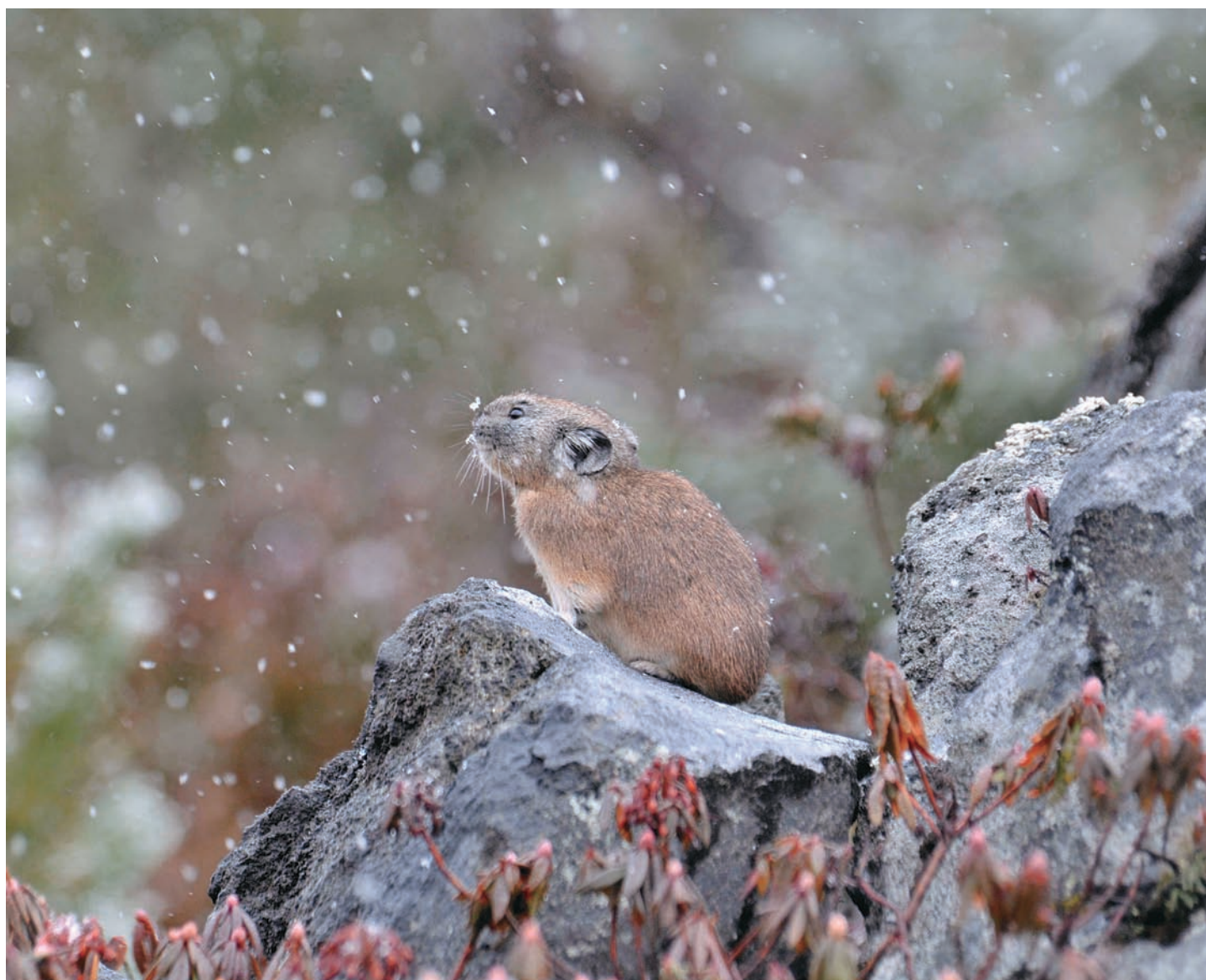
北海道の小動物～ナキウサギ 美瑛町