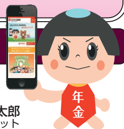
ねんきん太郎 「ねんきんネット」マスコット

この機会に、年金記録の確認や年金見込額を試算できる「ねんきんネット」で、ぜひ、ご自身の年金記録を確認いただくよう、従業員の皆様にご案内願います。